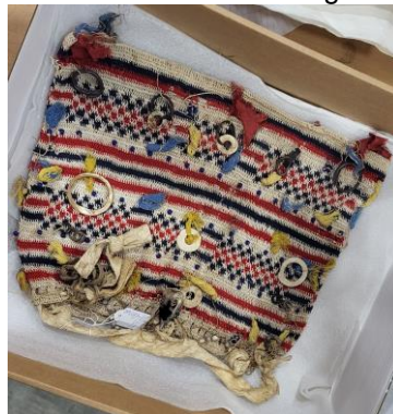
Tas uit het Sentani gebied gedragen tijdens traditionele dansen,

In deze streek liepen mannen veelal naakt, maar droegen bij feesten dansschorten van geklopte boombast, versierd met kralen. Vaak vindt men ook een ring van een centimeter of acht tot tien doorsnee, uit schelp gesneden, dat aan dergelijke schorten hangt. Die ring verwijst naar de (schoot van de) oude vrouw, de aarde waaruit alles voortkwam (een diepe onvruchtbare laag aarde, de mythische "kleiyewiya", is de laag waaruit de mens werd gevormd). In het verhaal komen behalve Kimani en Depun, de oude vrouw, kleiyewiya, en de dansschorten voor mannen voor. En de tifa, de zandloper trom, die wordt gebruikt om het zingen en deze dansen te begeleiden.