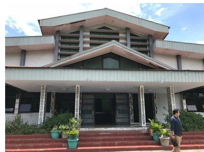
Het gebouw waarin het Museum is gehuisvest op de UNCEN campus in Abepura