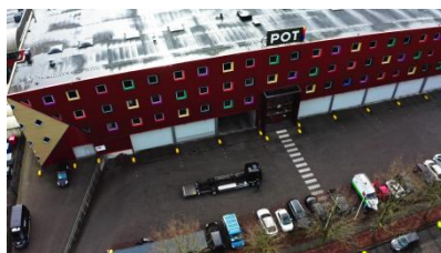
Depot Pot -Amersfoort