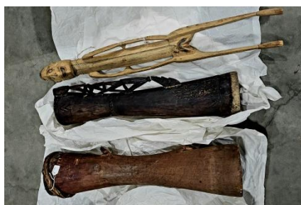
Enkele van de 1400 artefacten