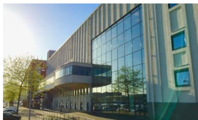
Gebouw IISG te Amsterdam