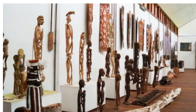
Een zaal in het Asmat museum.

Een belangrijke doelstelling van onze stichting is het terug brengen ofwel repatriëren van de collectie naar Papua opdat de eigen bevolking met haar historische artefacten kan kennis maken. Tot nu toe stuitte dit op factoren zoals een instabiele politieke situatie en onvoldoende continuïteit in de museum infrastructuur. Van een stabiele en bevredigende politieke situatie is helaas nog altijd geen sprake. Dat neemt niet weg dat we ons al enige tijd oriënteren op die andere factor. Het beschikbaar zijn van musea van voldoende kwaliteit en een gegarandeerde subsidiestroom om de continuïteit te waarborgen. Recent zijn hierin wat stappen gezet. In dit verband kunnen we wijzen op twee veelbelovende musea. Museum Lokabudaya in Abepura komt straks aan bod.