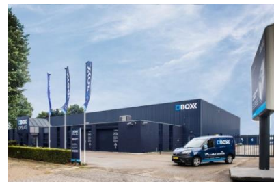
Boxx opslag – Amersfoort

werd voorgespiegeld. Allereerst bleek de verhuizing van de stukken uit de collectie van Het Koninklijk Paleis Soestdijk plotseling in een stroomversnelling te zijn gekomen. En ja, die gingen natuurlijk voor. Ten tweede dienden we een nieuwe accurate inventarisatie van de te verhuizen stukken te maken. Het bleek dat er verschillende lijsten in omloop waren, dat de aangegeven opslaglocaties bij depot Pot niet accuraat waren, er dubbele nummers gebruikt waren en de labels niet altijd met de lijsten overeenkwamen. Kortom er zat niets anders op dan de lijsten op orde te brengen en de stukken fysiek in de opslag te controleren en waar nodig in overeenstemming te brengen. Die operatie zit er nagenoeg op, op het moment dat deze nieuwsbrief verschijnt.