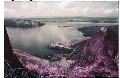
Cycloopgebergte met Sentanimmeer