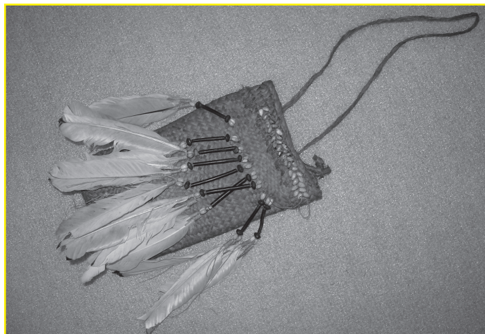
EA_18_63_b: Tasje gemaakt van vlechtwerk van pandabladd. Aan de voorkant is bovenaan een extra versiering aangebracht die bestaat uit een vlecht die is vastgezet met zijstroken op de bovenkant van de tas. Op deze rand is een versiering van pitjes geregen. Op de tas, onder de aparte randstrook is nog een extra versiering aangebracht, bestaande uit 9 over de breedte verspreide kwastjes.

De getoonde voorwerpen komen uit de PACE collectie en de collectie van het Universiteitsmuseum van de Rijksuniversiteit Groningen. Daar beheert adjunct-directeur/conservator Nico de Jonge onder andere de volkenkundige collectie die afkomstig is uit het voormalig Volkenkundig Museum 'Gerardus van der