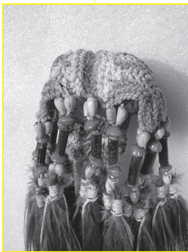
EA_71_22_b: Benen dolk met snijvlak van vier weerhaken. Aan weerszijden zijn kasuarisveren en rode en grijze pitten te zien, bijeengehouden door vlechtwerk.

Ontrafelde traditie, raffinement in textieltechnieken van West Papua 6 oktober tot eind december 2007