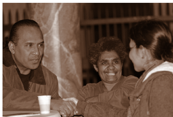
Papua Pride plek van ontmoetingen