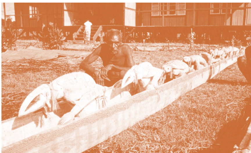
Papua met dodenprauw, uit de fotocollectie Anthony van Kampen