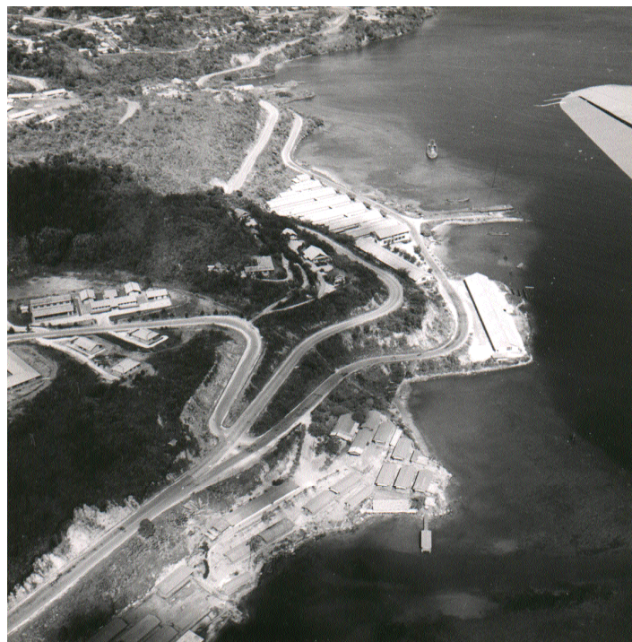
Hollandia: De driesprong bij het ziekenhuis in de vijftiger jaren van de vorige eeuw. De bebouwing in het Jayapura van nu is veel uitgebreider.

Inmiddels is PACE ook bezig met de uitvoering van haar eerste gesubsidieerde project. Het betreft de vertaling van de videodocumentaire 'PAIKEDA, Mens in Steen' geproduceerd door de stichting ApaMana in Amsterdam (apamana@planet.nl). In de vertaling gaat deze 55 minuten durende documentaire 'PAIKEDA, Batu Benda Orang' heten. De film is in de