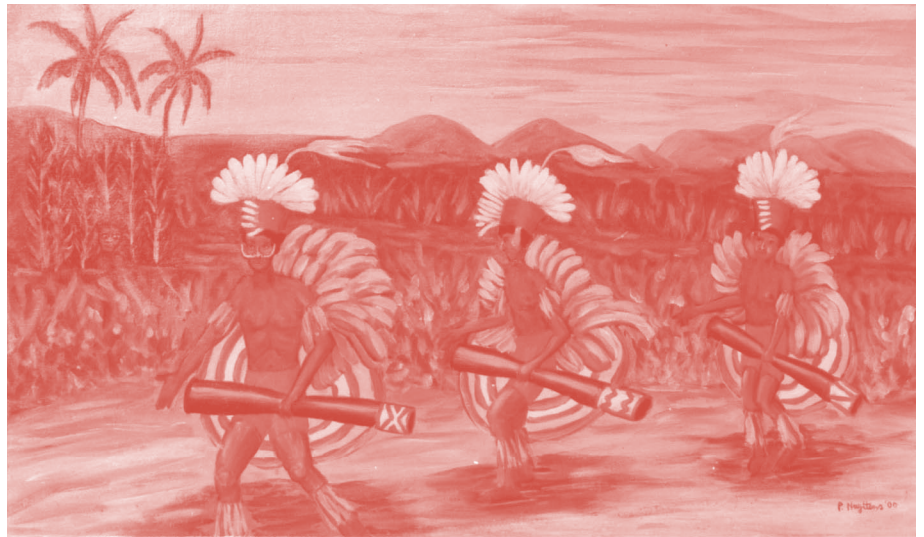
Zonsopgang na een nacht dansen van een genezingsceremonie door Arso mannen in Kerom Piet Nuyttens, olieverf op doek, 84 x 50 cm.

Tip: Van elk verkocht schilderij is 10% bestemd voor stichting PACE.